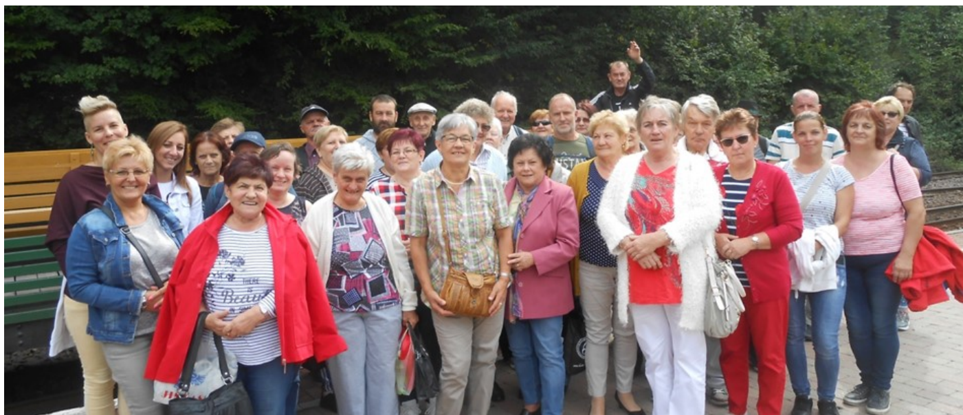
Megérkeztünk kisvonattal a szilvásváradai Gloriette tisztásra.

Az egyesület vezetősége pedig készül a 2020. évi tisztújításra, mivel mandátumunk lejár. (Kaltsitsné)