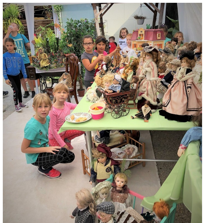
- Érdeklődők a babakiállításon -