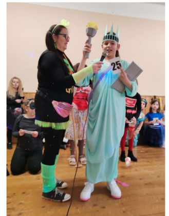
Az egyik győztes jelmez

Idei farsangi mulatságunkat 2025. február 14-én tartottuk a Faluházban. Nagyon vidám hangulatban telt el a délután. A jelmezes felvonuláson több mint 60 gyerek vett részt. Szébbnél-szebb, kreatív, mesebeli jelmezeket láthattunk. A zsűrinek nagyon nehéz dolga volt, tíz jelmezt jutalmaztunk oklevéllel és ajándékkal. Volt Rubik-kocka, Szabadságszobor, Őzike, szitakötő, boszorkány, rendőr, „lila dunszt”, cowboy, ninja, emoji, tavaszváró kémény, jégkocsi, szusi, bohóc, coca-cola és még sok más érdekes jelmez, felsorolni is hosszú lenne. A büfét a szülők üzemeltették, rengeteg finom sütemény, szendvics és pizzaszelet csillapította az éhséget. A zenét DJ. Kinga szolgáltatta. Fergeges hangulat kerekedett a buli végére, limbó hintóztunk, ment a Szerelemvonal az utasaival körbe-körbe, a vidám közönség integetett, énekelt. Köszönjük mindenkinek a szervezési munkákat és a támogatást, segítségét.